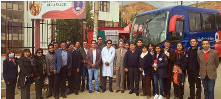
FIRMA DE COOPERACIÓN INTERINSTITUCIONAL ENTRE EL SERVICIO DEPARTAMENTAL DE CAMINOS Y LA UNIVERSIDAD TÉCNICA DE ORURO

El Decano de la Facultad y el Representante estudiantil agradecieron, este apoyo, que servirá para brindar mejores condiciones de traslado para docentes y estudiantes.