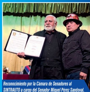
Reconocimiento por la Cámara de Senadores al SINTRAUTO a cargo del Senador Miguel Pérez Sandoval.