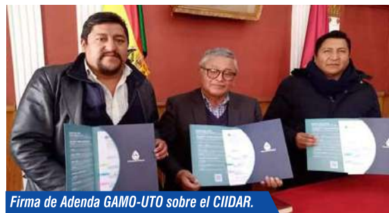
Firma de Adenda GAMO-UTO sobre el CIIDAR.

Proyecto ambicioso que tiene el apoyo de la Agencia de Cooperación Española AECID, para el efecto se vienen sosteniendo reuniones de coordinación. El CIIDAR se constituye en el único Centro en la región que investigará temas de aguas Residuales en Zonas de Altura.