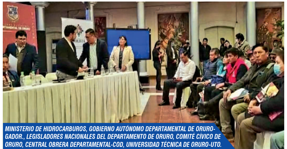
MINISTERIO DE HIDROCARBUROS, GOBIERNO AUTÓNOMO DEPARTAMENTAL DE ORURO-GADOR., LEGISLADORES NACIONALES DEL DEPARTAMENTO DE ORURO, COMITÉ CÍVICO DE ORURO, CENTRAL OBRERA DEPARTAMENTAL-COD, UNIVERSIDAD TÉCNICA DE ORURO-UTO.

El Ministerio de Hidrocarburos y Energías, Yacimientos del Litio Bolivianos, la Universidad Técnica de Oruro, la Brigada Parlamentaria y la SIB entre otras Instituciones del departamento, forman parte fundamental en la “Socialización de la Industrialización del Litio”, con la premisa de que Bolivia tiene el Potencial para producir Carbonato de Litio, Cátodos hasta lograr la cadena de Valor del Litio en el País.