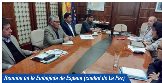
Reunión en la Embajada de España (ciudad de La Paz)

Desde el Ministerio de Medio Ambiente y Agua, el Gobierno Autónomo Municipal de Oruro y la Universidad Técnica de Oruro, en breve iniciaran las obras civiles para su construcción del CIIDAR Centro de Investigación del Tratamiento de Aguas Servidas en Oruro (zona sud-este), para el desarrollo de tecnologías y posterior reciclaje en el desarrollo de la producción ganadera mismo que será replicado a otras ciudades del departamento.